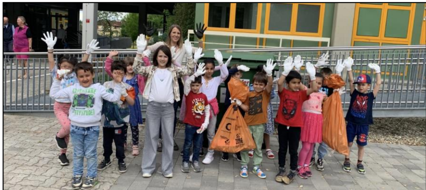
Schülerinnen und Schüler der Volksschule Oberndorf; Bild: Anneliese Weissenböck

Im Frühjahr, wenn der Schnee schmilzt, tauchen nicht nur Blumen auf, sondern auch eine Menge Müll entlang von Wegen und Straßen. Die heurige Aktion „Sauberes Salzburg“ wurde wie schon in den vergangenen Jahren von der Salzburger Abfallbeseitigung, der Zemka so-